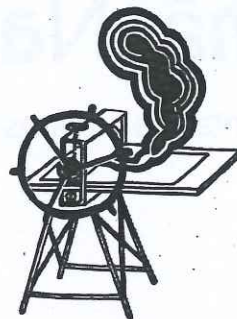
FÁBRICA DE ESTAMPAS